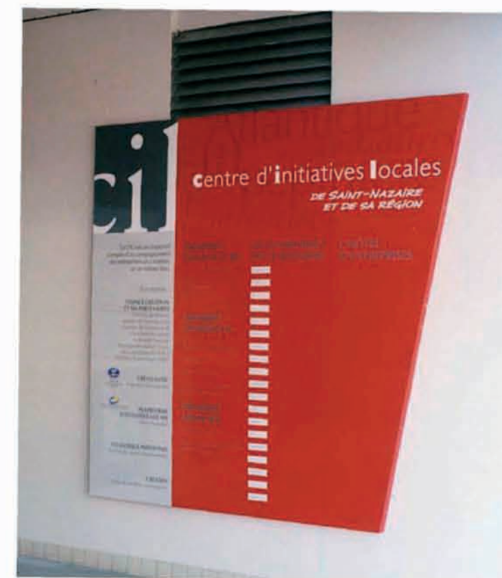
Verre, aluminium, marquage adhésif.